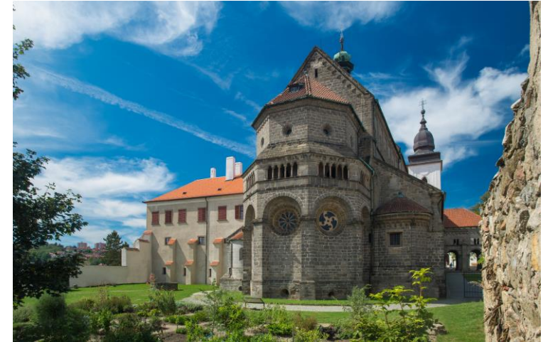
Basilika St. Prokop in Třebíč, UNESCO Weltkulturerbe

Heute widmen wir uns zuerst dem Kloster Želiv. Im Jahr 1139 gegründet, lebten hier zunächst Benediktiner, die aus einer nahegelegenen Abtei gekommen waren. Später ließen sich Prämonstratenser aus dem rheinland-pfälzischen Steinfeld nieder. Im Laufe seiner Geschichte musste das Kloster nach verheerenden Bränden mehrfach umgebaut werden. Die umfassendsten Baumaßnahmen erfolgten im frühen 18. Jh. im Stil der Barockgotik und wurden vom berühmten Baumeister Johann Blasius Santini-Aichl durchgeführt.